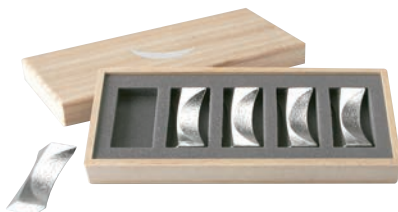
②能作 錫 箸置 「月」5ヶ入