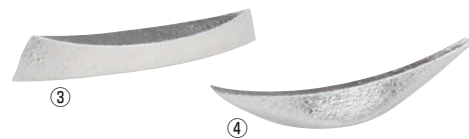
能作 錫 箸・ナイフレスト